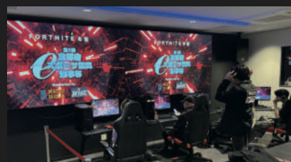
京都府eスポーツ振興知事杯 運営受託

その他、店舗運営実績としてグループ直営北九州イノベーションセンター「REDEEイノベーションセンター店」・「JOYPOLIS SPORTS北九州イノベーションセンター店」/プログラミングスクール (e2PARK) 運営etc.