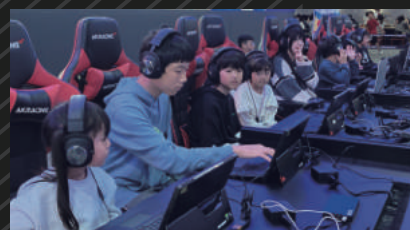
ららぽーとeスポーツ杯 関西地区No.1決定戦 民間受託オフラインイベント