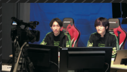
REDEE GAMING ONLINE CUP 自社開催オンライン配信 ※複数タイトルで定例開催