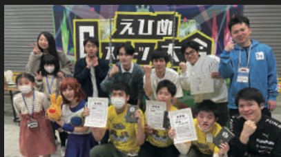
えひめeスポーツフェスティバル 自治体受託イベント事例