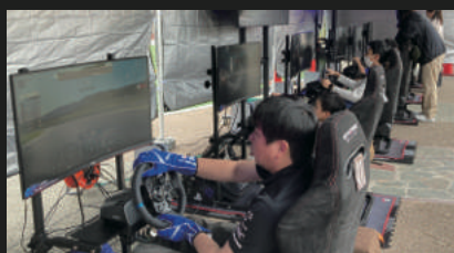
オートボックス e-Motorsports Experience