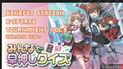
Benefit Station esports Tournament 民間受託オンライン配信

REDEE Gamingの事業領域は、イベント事業の他、法人・学生連携事業、店舗事業、eスポーツプロチーム事業と多岐に渡ります。その中よりイベント実績や実例をご紹介します。