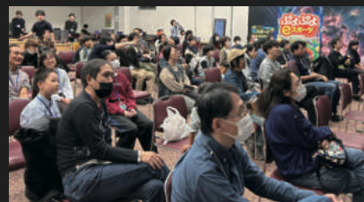
大東eスポーツチャレンジカップ 自治体受託イベント