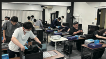
インテルPCマイスター資格制度 企画連携プロジェクト